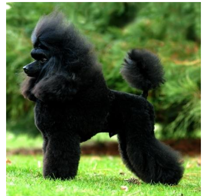
Dwergpoedel zwart