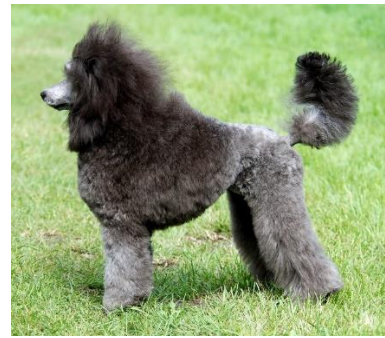
Dwergpoedel grijs