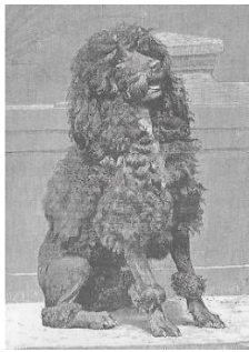
Graaf van Bylandt 1904