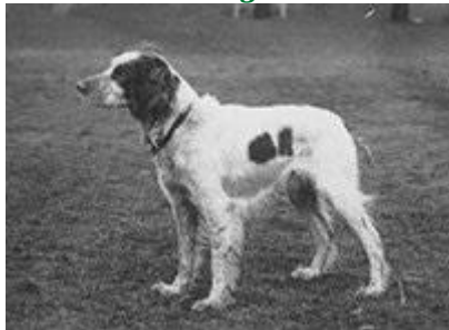
Website EBC 1931