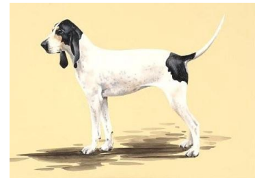
Afb. FCI Petit Gascon Santongeois