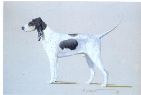
Afb. FCI Grand Gascon Santongeois