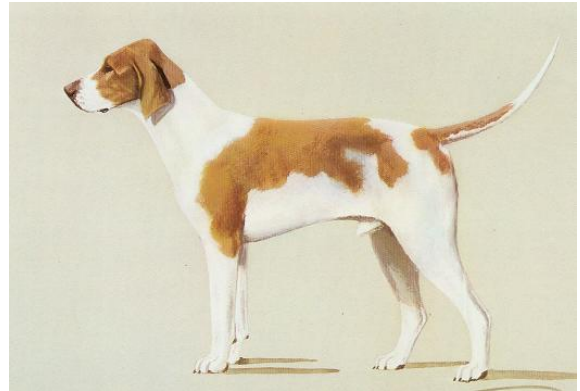
Afb. FCI Rasstandaard