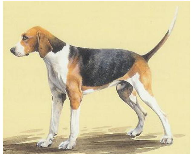
Afb. FCI Rasstandaard