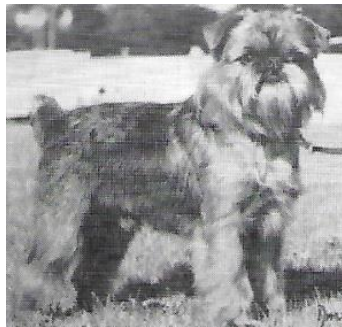
Griffons en Brabançon HW 1991