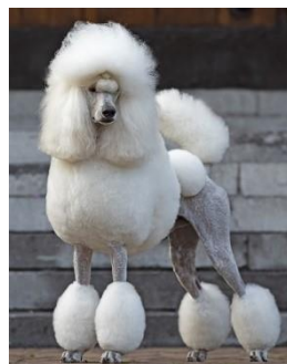
Poedel Groot