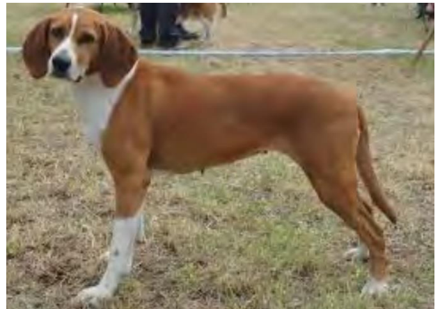
Afb. Dummerkompendium Noorse Hygenclub