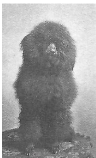
poedel kroesharig Graaf van Bylandt