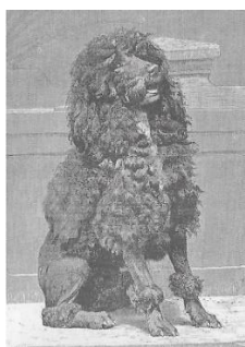
Graaf van Bylandt 1904