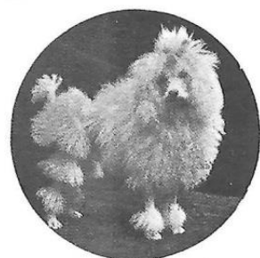
Poedel kroesharig 1904