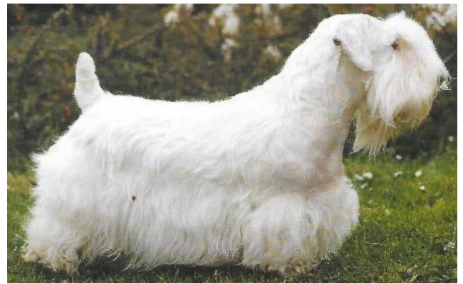
Fot:o: HW Alce van Kempen