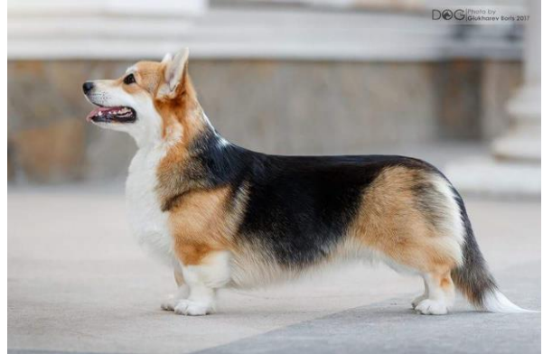
Driekleur teef met correcte verhoudingen